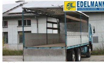
Visit us under www.e-truck.ch