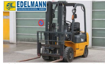
Visit us under www.e-truck.ch