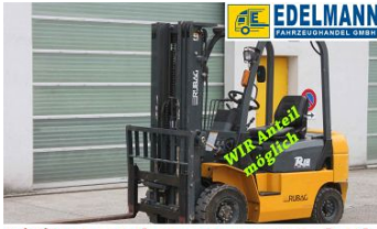
Visit us under www.e-truck.ch