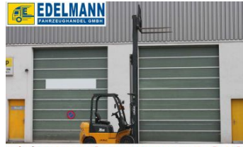
Visit us under www.e-truck.ch